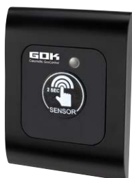
Caramatic GasControl Bedienteil