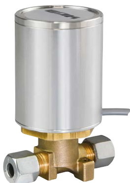
Caramatic GasControl Magnetventil